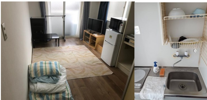
←浦和区内の緊急避難用アパート