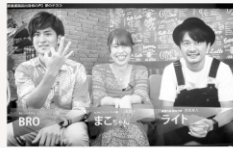
動画での情報発信

もう一つの当事者の活動としては、私自身の幼少期に受けた虐待や児童養護施設にいた経験を話すことで、自分事ではなく社会問題であるという発信をしています。発信は主に動画媒体での情報発信と講演会です。情報発信は、児童養護施設出身の三人によるYouTube情報発信番組「THREE FLAG（スリーフラッグス）希望の狼煙」という番組を通して自身の体験を語り、同じような過の子や現在も施設にいる子たち、退所後に困っている人たちに、そして、渦中にある子どもたちに希望を込めてメッセージを送る情報発信のコンテンツを作っています。